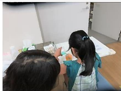
保冷剤から消臭ポット作り 仕上げの手順、ゆっくりと色を重ねます