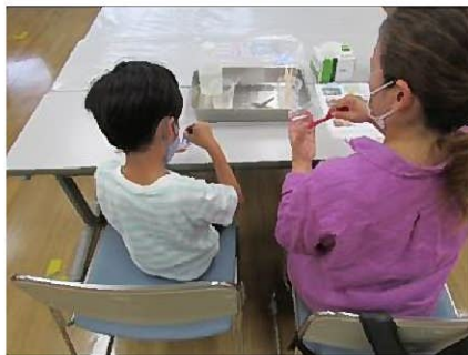
消臭ポット作りには使える保冷剤の説明のあと 最初の手順をやってみよう！