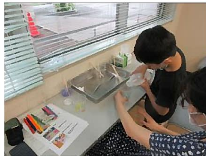
保冷剤から消臭ポット作り 2つ以上の色を使うと何色になるかな？！