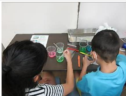
水性ペンで色を付けます さまざまな色になりました