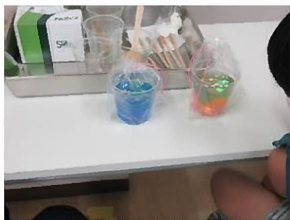
消臭ポットの表面に飾りを浮かべました 出来上がった作品、キレイです！